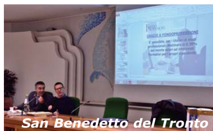
San Benedetto del Tronto