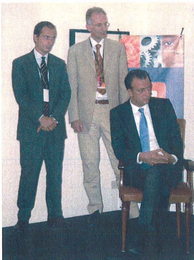
Rappresentanti delle Aziende partecipanti al "Premio Speciale Quadrifor"